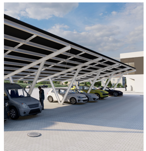
Przykładowe wizualizacje. Możliwość dostosowania wymiarów do indywidualnych wymagań inwestora.