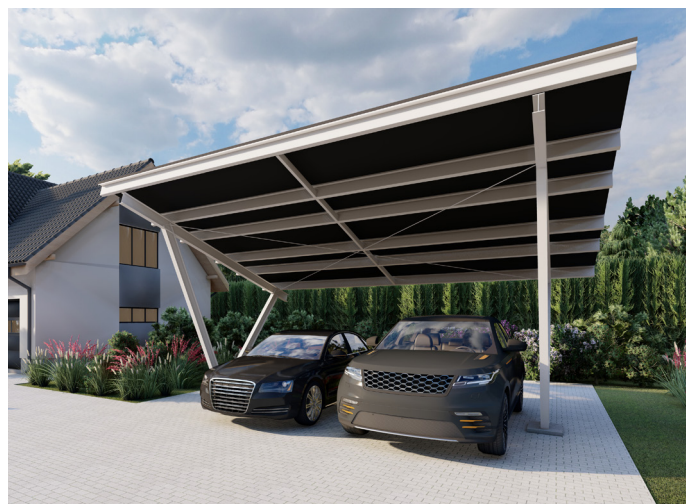
Przykładowe wizualizacje. Możliwość dostosowania wymiarów do indywidualnych wymagań inwestora.