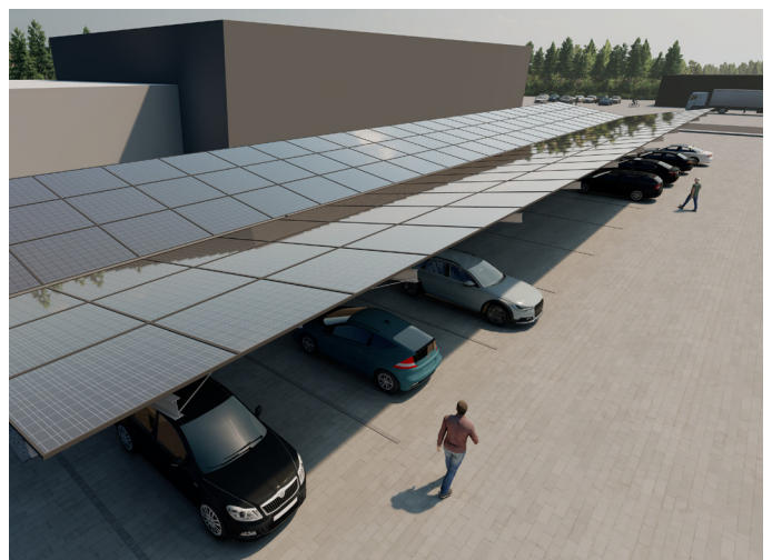
Przykładowe wizualizacje. Możliwość dostosowania wymiarów do indywidualnych wymagań inwestora.