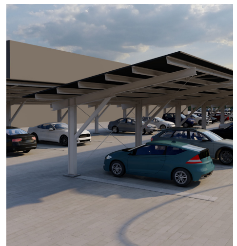
Przykładowe wizualizacje. Możliwość dostosowania wymiarów do indywidualnych wymagań inwestora.